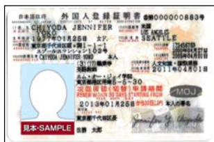
外國人登錄證明書