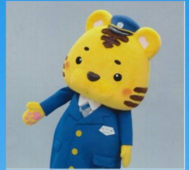
大阪入国管理局マスコットキャラクター えんトラくん

審査場見学、鑑識体験、職員との質疑応答等、入国審査官の魅力をお伝えできる内容となっています。皆様の参加をお待ちしています！